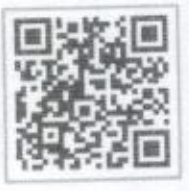
กระทรวงศึกษาธิการ และ รายละเอียดเพิ่มเติม