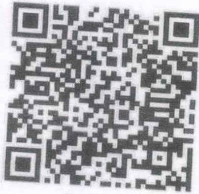
ไฟล์เสียง ภาษาไทยมาตรฐาน