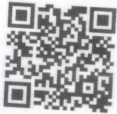
แผ่นภาพ ประชาสัมพันธ์