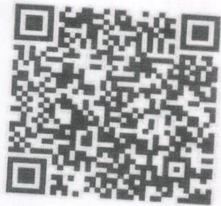
หมู่บ้าน อพป.จังหวัดชัยภูมิ