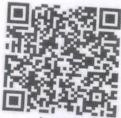
ไฟล์เสียง ภาษาไทยถิ่นอีสาน