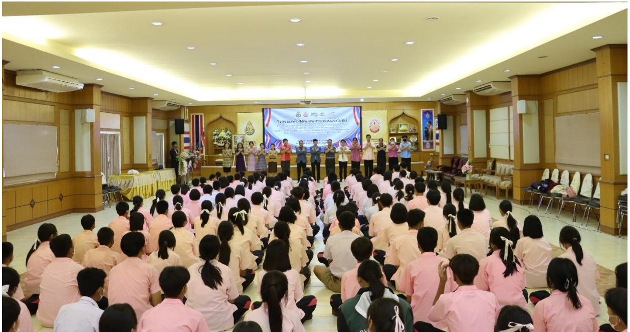
กิจกรรมโครงการเสริมสร้างคุณธรรม จริยธรรม และธรรมาภิบาลในสถานศึกษา ผ่านกิจกรรม One Classroom One Project (OCOP) โรงเรียนภูเขียว